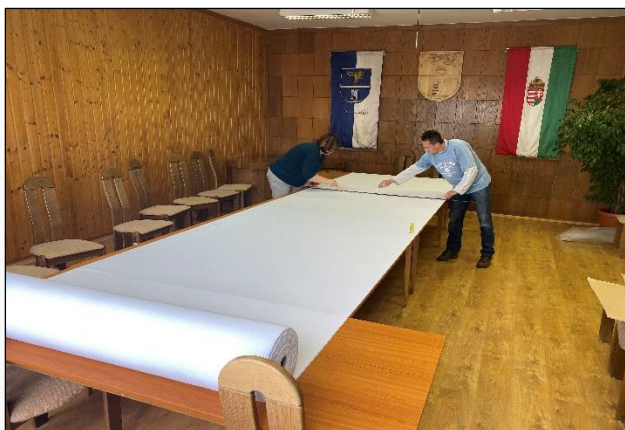
A hivatal dolgozói méretre szabják az anyagot