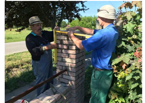
Pillanatkép a munkálatok közben

A térkövező brigád következő helyszíne az Ady utcai orvosi rendelő, ahol tavasszal fejeződött be az épület teljes felújítása. A rendelő előtti és melletti területet újítja fel az önkormányzat kerítéssel, parkolókkal és új járdaszakasszal.