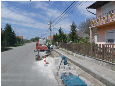
A közutas csapat is nagy lendülettel építi tovább a Rákóczi utcai járdát.