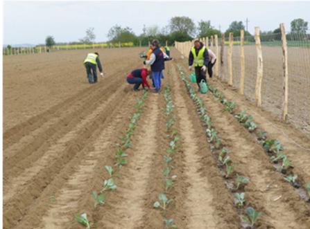
Bekerítésre került a káposztaföldünk a Bercsényi utca felett. Dolgozóink szorgalmasan ültetnek bele több mint tízezer palántát.