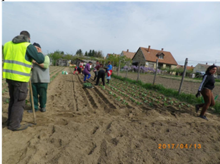
Zrínyi utcai kertben már sikeresen kiültették a káposzta palántákat.